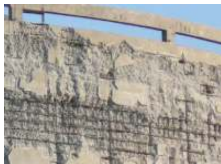
Die Außenmauern des Kern-Kraftwerks Tihange: nicht nur sie sind marode.

Beide Reaktoren weisen enorme altersbedingte Schäden in den Druckbehältern auf. Allein bei Doel 3 sind 12.000 „Einschlüsse“ = Risse im Reak- tordruckbehälter festgestellt worden.